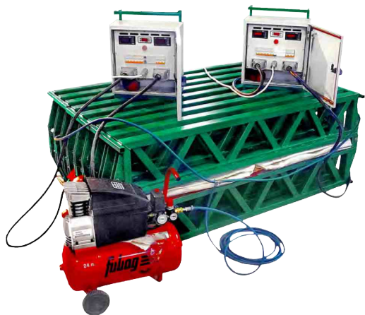
Вулканизатор конвейерный ВК-1500/1000